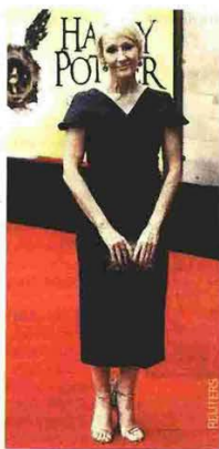
Η συγγραφέας πάντως Τζ.Κ. Ρόουλινγκ δήλωσε ότι τα μάγια... άυθηκαν

Η συγγραφέας, μιλώντας για την απόφασή της να γράψει τη θεατρική ιστορία για τον Χάρι Πότερ μαζί με τους Τζακ Θον και Τζον Τζιαν, είπε: «Ήταν τρομακτικό. Νομίζω ότι την τελευταία δεκαετία δεχόμουν τρεις προσφορές την εβδομάδα για να κάνω ένα μουσικάλ ή ένα θεατρικό ή μία παράσταση πάγου ή μία όπερα. Δεν το αποφάσισα μέχρι που γνώρισα τη θεατρική παραγωγή Σόνια Φρίντμαν