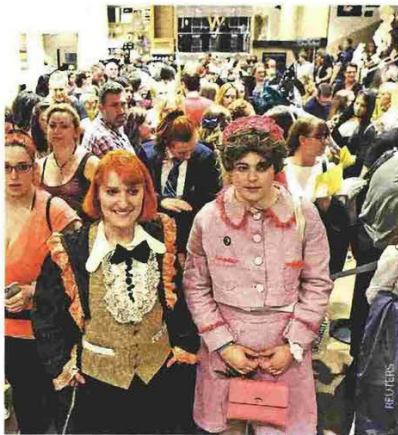
Ουρές στα βιβλιοπωλεία για το βιβλίο «Ο Χάρι Πότερ και το Καταραμένο Παιδί» και την ομώνυμη παράσταση στο Palace Theatre.