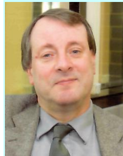
Ο ΑΛΙΣΤΕΡ ΜΑΚΓΚΡΑ Θ γεννήθηκε στο Μπέλφαστ της Βόρειας Ιρλανδίας

Από το βιβλίο αυτό δεν λείπει κανένας: Ο Βολταίρος, ο Μαρκήσιος ντε