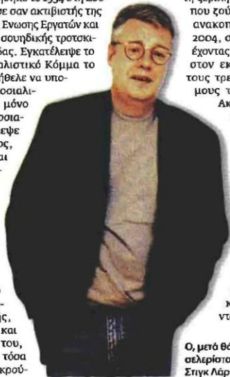
Ο, μετά θάνατον, μπεστ-σελέριας, Σουηδός Στιγκ Λάρσον

Σε αυτά ανακάτηψε το πολιτικό θρίλερ με το αστυνομικό νουάρ, παίζοντας έξυπνα με όλα