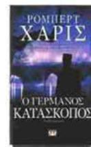
Ο ΓΕΡΜΑΝΟΣ ΚΑΤΑΣΚΟΠΟΣ