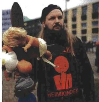
Ο κύριος αυτός υπήρξε οικότροφος σε εκκλησιαστικό ίδρυμα. Διαμαρτύρηται όχι μόνο για τα κρούσματα κακοποίησης αλλά και γιατί το κράτος έκανε τα στραβά μάτια

“ Σ’ ένα κλειστό κύκλωμα, όπως είναι η Εκκλησία, όπου δεν επιτρέπεται καμία σεξουαλική σχέση, ο πειρασμός για σεξουαλική κακοποίηση παιδιών είναι μεγαλύτερος ”