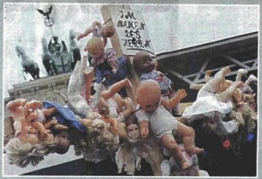
Κούκλες κρεμασμένες σε σταυρού, στην κορυφή του οποίου είναι γραμμένο: «Στο όνομα του Θεού». Πρωτότυπος τρόπος διαμαρτυρίας στο Βερολίνο, μπροστά από την Πύλη του Βραδεμβούργου για τα σεξουαλικά σκάνδαλα της Καθολικής Εκκλησίας