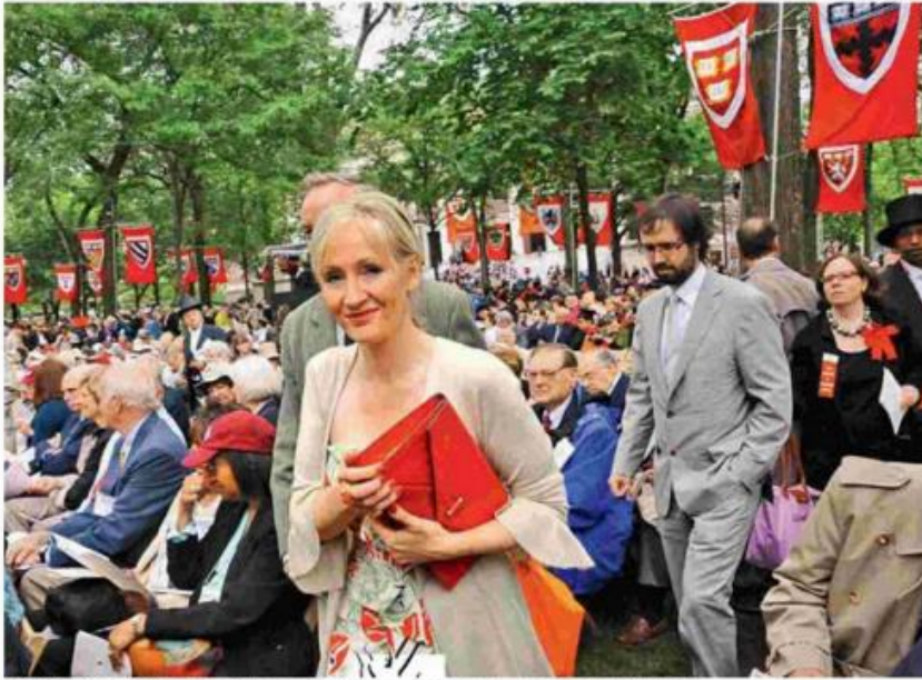
Η Τζ. Κ. Ρόουλινγκ στο περιθώριο της ομιλίας της προς τους αποφοίτους του Χάρβαρντ.

ζονται το πώς θα τα καταφέρουν, όχι το πώς θα αποτύχουν. Η Τζ. Κ. Ρόουλινγκ στη σύντομη ομιλία της αποδομεί ό,τι ενδεχομένως φαντάζονταν και τους καλεί να σκεφτούν «ανάποδα», όπως μόνον οι μάγοι σκέφτονται.