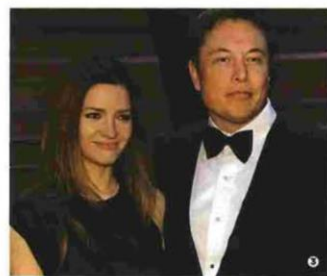
1. Εργαζόμενοι στο εργοστάσιο της Tesla επιβλέπουν την παραγωγή του οχήματος Model S, του πιο ευπώλου ηλεκτρικού αυτοκινήτου παγκοσμίως το 2015 και το 2016. 2. Με τη μητέρα του, Μά Μασκ, στο πάρτι του «Vanity Fair» για την απονομή των Όσκαρ το 2017. Η 70χρονη καλλονή εργάζεται ακόμη και σήμερα ως μοντέλο. 3. Με τη δεύτερη σύζυγό του, Ταλούλα Ράιτ, με την οποία έχουν παντρευτεί και χωρίσει δύο φορές, τον Μάρτιο του 2014.