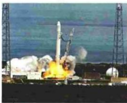
Η στιγμή της δοκιμαστικής εκτόξευσης του διαστημικού οχήματος Dragon της εταιρείας SpaceX από την αεροπορική βάση του Ακρωτηρίου Κανάβερλ τον Ιούνιο του 2010.

Αυτοδημιούργητος δισεκατομμυριούχος, πρωτοπόρος της ψηφιακής εποχής, ηγέτης της ηλεκτροκίνητης αυτοκίνησης και οραματιστής της διαστημικής εξερεύνησης, ο 47χρονος entrepreneur απασχολεί διαρκώς τον διεθνή τύπο με τους καλοσσιαίους επιχειρηματικούς θριάμβους και τις τιτάνιες λεκτικές αστοχίες του. Η βιογραφία του, που θα κυκλοφορήσει σύντομα στα ελληνικά, επιχειρεί να αποκρυπτογραφήσει τον μυστηριώδη Mr. Tesla.