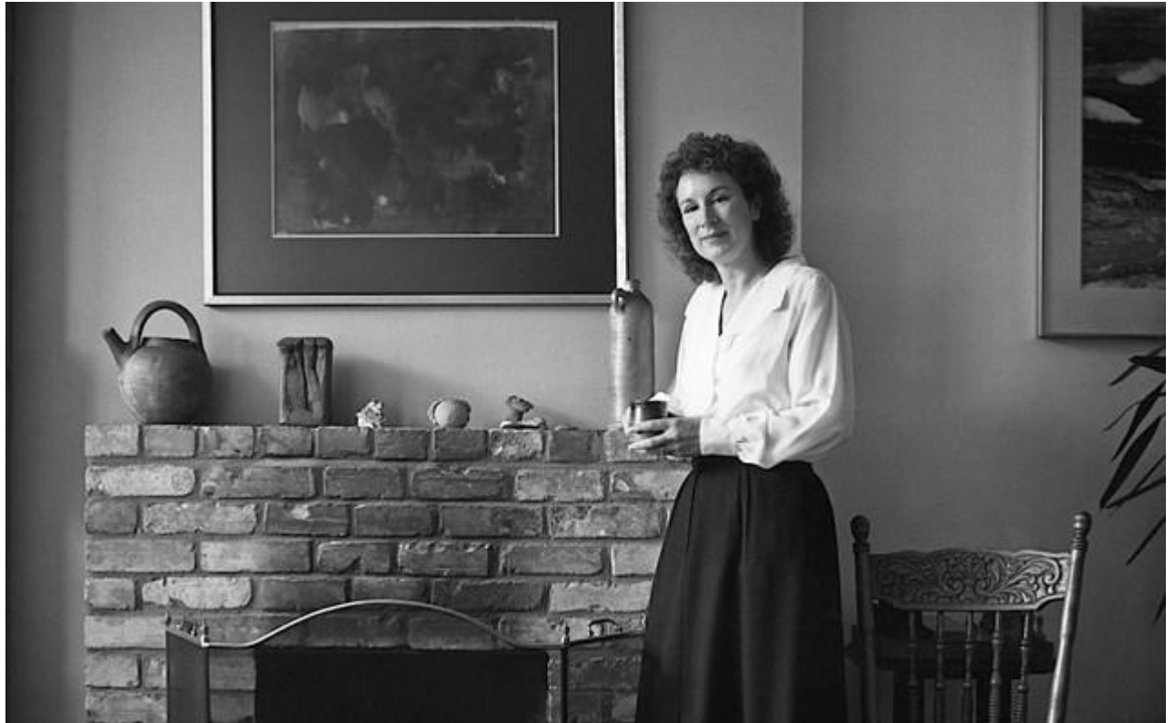
Μάργκαρετ Άτγουντ, 1984.

Ταξίδεψε πολύ και άλλαξε διάφορα επαγγέλματα: ταμίας, σερβιτόρα, σύμβουλος κατασκηνώσεων, λέκτορας αγγλικής λογοτεχνίας και, τέλος, συγγραφέας. Εκτός από καταξιωμένη ποιήτρια, η Μάργκαρετ Άτγουντ είναι σήμερα η διασημότερη πεζογράφος και κριτικός του Καναδά. Έχει γράψει περισσότερα από 40 μυθιστορήματα, ποιήματα, παιδικά βιβλία και δοκίμια. Κατά τη διάρκεια της συγγραφικής της καριέρας, έχει τιμηθεί με αμέτρητα βραβεία στον Καναδά και το εξωτερικό, μεταξύ των οποίων τα: Premio Mondello (1997), Commonwealth (1987 και 1994), Booker (1989, 1996, 2000, 2003, 2005 και 2007) και Orange (2001 και 2004). Τα βιβλία της έχουν μεταφραστεί σε περισσότερες από 40 γλώσσες. Σήμερα, ζει στο Τορόντο με τον σύντροφό της, τον συγγραφέα Γκρέιμι Γκίμπσον.