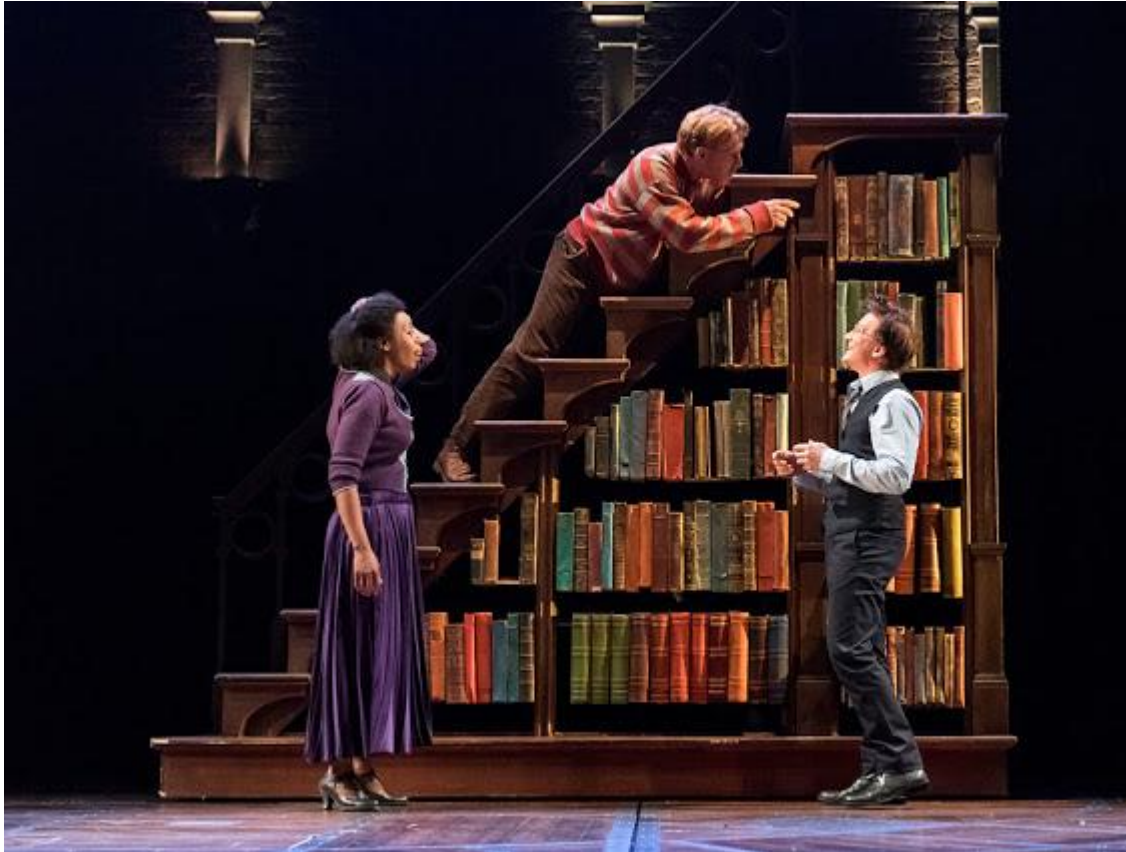
West End Production of the new play Harry Potter and the Cursed Child

Όποιος δεν έχει διαβάσει τα βιβλία του Χάρι Πότερ (ή δεν έχει δει τις ταινίες) θα δυσκολευτεί πολύ να παρακολουθήσει τα όσα διαδραματίζονται. Οι αναφορές σε γεγονότα των προηγούμενων βιβλίων (κυρίως στα « Ο Χάρι Πότερ και το Τάγμα του Φοίνικα », « Ο Χάρι Πότερ και ο αιχμάλωτος του Αζκαμπάν » και « Ο Χάρι Πότερ και οι Κλήροι του Θανάτου ») είναι πολλές και απαιτούν γνώση του μυθικού σύμπαντος του μικρού μάγου. Ήρωες που μισήσαμε και μετά αγαπήσαμε, όπως ο bigger than life καθηγητής Σνέιπ, άλλοι που δεν καταφέραμε να γνωρίσουμε, όπως οι γονείς του Χάρι, με έναν «μαγικό» τρόπο επανέρχονται και μας συγκινούν (ναι, κατάφερε και πάλι να με συγκινήσει!).