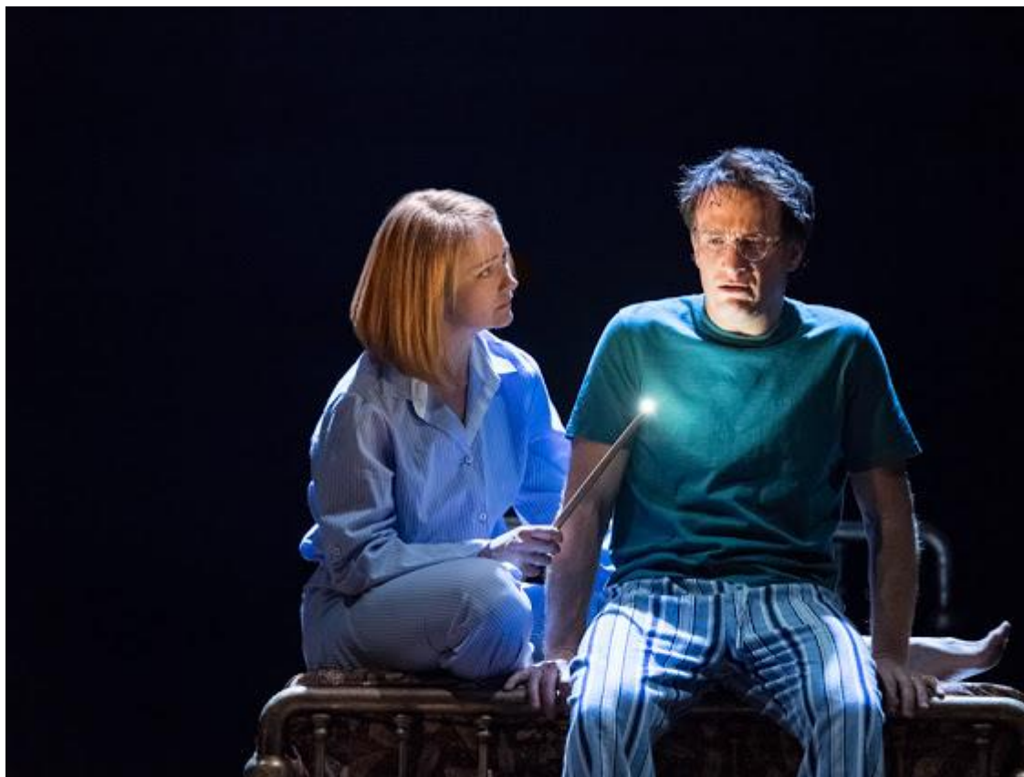
West End Production of the new play Harry Potter and the Cursed Child

Νοέμβριο του 2007 (σε ένα στρατόπεδο στην Τρίπολη). Το γεγονός ότι το βιβλίο αποτελεί θεατρικό κείμενο δεν με ενόχλησε, ενώ διαβάζοντας την τελευταία σελίδα θα ήθελα απλά να διακτινιστώ στο Palace Theatre, για να δω τα όσα μαγικά διαβάζω να διαδραματίζονται στη σκηνή (και αυτά που γίνονται στη σκηνή, όπως έμαθα, δεν έχουν ξαναγίνει σε θέατρο, κάνοντας κοινό και κριτικούς να παραληρούν!)