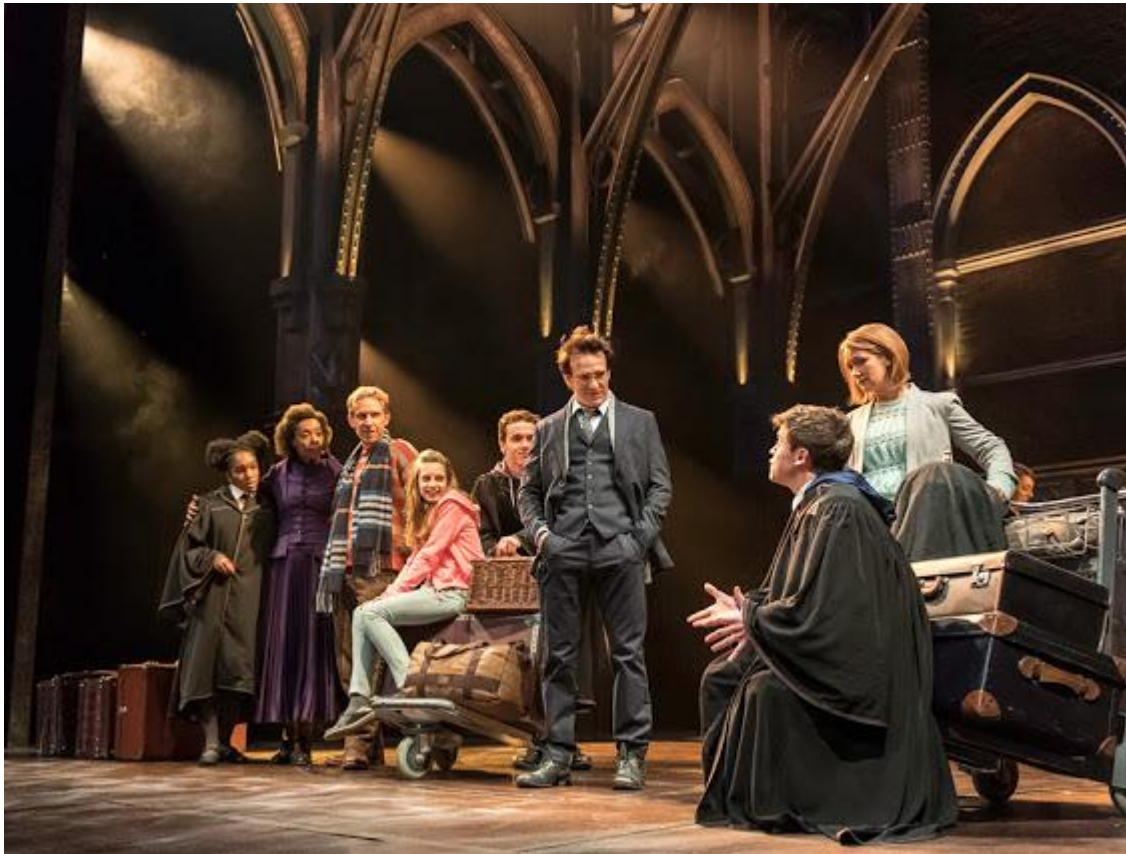
West End Production of the new play Harry Potter and the Cursed Child

Η φιλία, η ανδρεία, η θυσιαστική αγάπη, η απώλεια και το πένθος, η δύσκολη ενηλικίωση επανέρχονται και σε αυτή την όγδοη ιστορία του Χάρι Πότερ πασπαλισμένες με μπόλικη μαγεία και μια ατμόσφαιρα μοναδική.