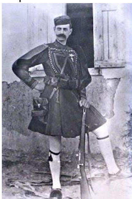
Από τον Πρόξενο Κορομηλά

Αντάμα με τους μυθιστορηματικούς ήρωές ο Θεοδωρής Παπαθεοδώρου σκιαγραφεί υποδειγματικά τα εμπλεκόμενα υπαρκτά πρόσωπα του Μακεδονικού Αγώνα, καταγράφοντας αληθινά περιστατικά.